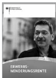
Broschüre Erwerbsminderungsrente, Bestellnr. A 261

Dabei ist zwischen denjenigen Personen zu unterscheiden, die (laufende) Leistungen der Sozialhilfe (z.B. Hilfe zum Lebensunterhalt oder Grundsicherung im Alter und bei Erwerbsminderung) erhalten, und solchen, die voraussichtlich nicht mindestens einen Monat ununterbrochen Hilfe zum Lebensunterhalt beziehen (z.B. Nichtsesshafte). Erstere sind gesetzlich Krankenversicherten gleichgestellt. Für sie gilt der Leistungskatalog der gesetzlichen Krankenversicherung. Sie erhalten in der Regel eine Krankenversicherungskarte von einer Krankenkasse ihrer Wahl aus dem Bereich des jeweiligen Sozialhilfeträgers. Die Krankenkasse rechnet die erbrachten Leistungen dann mit dem Sozialhilfeträger ab.