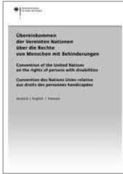
Broschüre Die UN-Konvention, Bestellnr. A 729

Viele Leistungen der Eingliederungshilfe für Menschen mit Behinderungen werden unabhängig vom Einkommen und Vermögen der Menschen mit Behinderungen erbracht. Auf eine Heranziehung Unterhaltspflichtiger zu den Kosten der Eingliederungshilfe wird verzichtet, wenn dies für die Betroffenen eine unbillige Härte bedeuten würde. Erhält ein volljähriges Kind