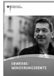
Broschüre Erwerbsminderungsrente, Bestellnr. A 261

Personen, die für eine befristete Zeitdauer voll erwerbsgemindert sind, haben bei Hilfebedürftigkeit einen Anspruch auf Hilfe zum Lebensunterhalt. Sind Personen dauerhaft voll erwerbsgemindert oder haben sie ein Lebensalter erreicht, das der für sie geltenden Regelaltersgrenze in der gesetzlichen Rentenversicherung entspricht, dann besteht ein Anspruch auf Grundsicherung im Alter und bei Erwerbsminderung.