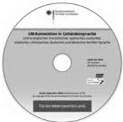
DVD zur UN-Konvention mit Gebärdensprachfilmen, Bestellnr. D 729

Nähere Auskünfte zu den Leistungen der Eingliederungshilfe und zur etwaigen Heranziehung des Menschen mit Behinderungen und seiner Angehörigen zu den entstehenden Kosten erteilt Ihnen das zuständige Sozialamt.