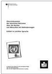
Broschüre Die UN-Konvention in leichter Sprache, Bestellnr. A 729L

mit Behinderungen Eingliederungshilfe, geht der Unterhaltsanspruch des Kindes gegenüber seinen Eltern generell nur in Höhe von bis zu 32,75 Euro/Monat (mit Erhöhung des Kindergeldes ab dem 1. Januar 2018) auf den Träger der Sozialhilfe über.